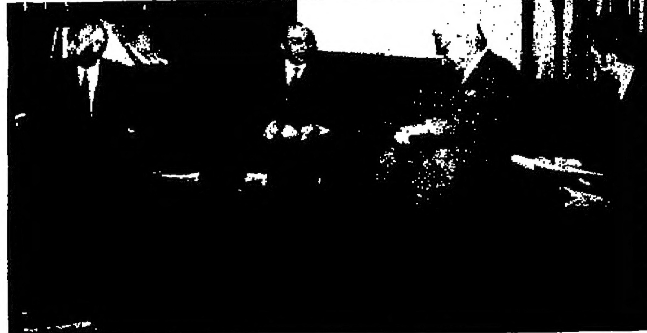
عقد السيد بهجت التلهوني رئيس الوزراء يبحث الى وفد الاسكندرية الاسرائيليين

لا موعد مقترح وقالت وزارة الخارجية اللبنانية نسفة لها امس لم تقترح اي موعد لعقد هذا الاجتماع . الا انها توضح ان العراق يرى من الضروري في الوقت الحاضر عقد مثل هذا الاجتماع لتسيو القانون العسكري بين الدول العربية .